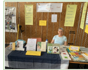
Pont Ste Maxence

Comme chaque année, Jalmalv-Compiègne participe à différents forums des associations. Nous y rencontrons des personnes de toutes origines et de tout âge, nous faisons connaître notre association, l'espace Deuil à Vivre et les Soins Palliatifs. Ces journées sont différentes dans chacun des forums organisés différemment et dont le public diffère lui aussi. Des contacts sont parfois pris pour rejoindre notre équipe. Ces forums sont suivis d'une journée de sensibilisation elle-même point de départ de la formation de nouveaux bénévoles. Nous apprécions d'y avoir une place ; les rencontres y sont nombreuses et intéressantes. Elles marquent aussi un engagement des bénévoles qui acceptent de donner de leur temps pour une présence sur place.