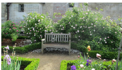
La Roseraie, Parc du Château

Pour tous renseignements complémentaires, n'hésitez pas à nous contacter JALMALV Compiègne 5, Square des Acacias 60 200 COMPIÈGNE Tél. : 03 44 20 95 26 jalmalv.compiegne@orange.fr